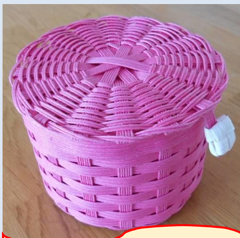
作品名：蓋つき小物入れ 作成期間：3週間