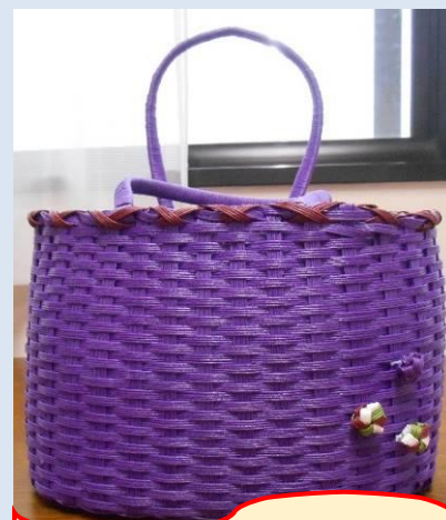
作品名：買い物かご 作成期間：約1か月半