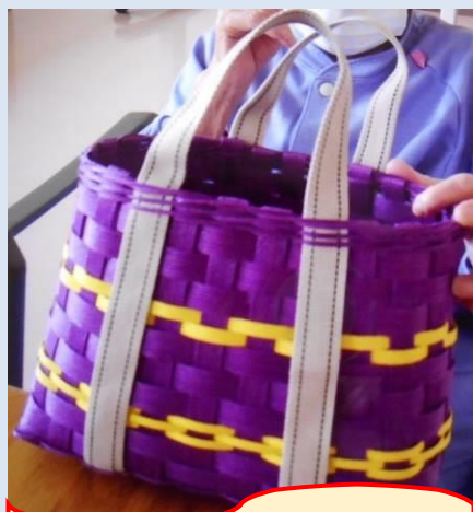
作品名：マルシェバッグ 作成期間：2～3週間

藤元上町病院に入院されている患者様のエコクラフト作品を紹介します。 患者様がリハビリの一環として作成された作品です。